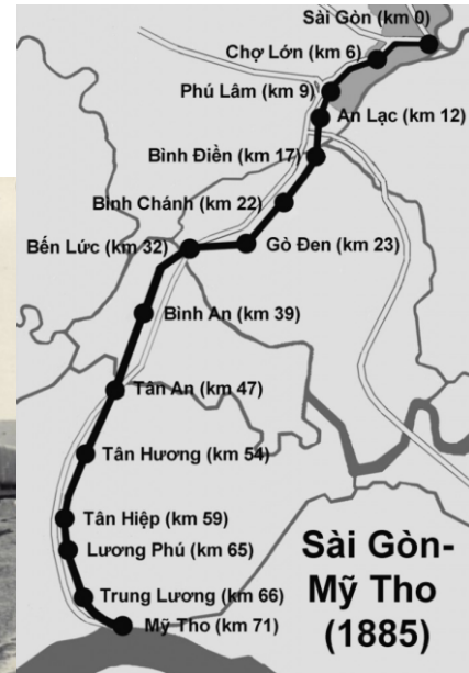
Le chemin de Sài Gòn - Mỹ Tho

Puis, les Français ont construit des bâtiments qu'ils ont utilisés comme les ports militaires, les églises, ou les villas pour des officiers français ; mais pas les bâtiments résidentiels pour les Vietnamiens. C'est important de noter que les premiers Français, qui sont arrivés au Viêt Nam, sont les évangélistes missionnaires, dont le plus populaire était Alexandre de Rhodes, qui a eu une influence majeure sur la langue vietnamienne. Alors, la religion chrétienne était une partie très importante dans l'occupation française au Viêt Nam. Une représentation des églises françaises est le Cathédrale Notre-Dame de Saïgon. C'est un édifice de style roman qui a été construit au centre de la ville. Aujourd'hui, cette cathédrale est l'un des symboles de Hô-Chi-Minh-Ville (le nom moderne de Saïgon). Il y a aussi d'autres bâtiments qui ont été construits par les Français à Saïgon. Maintenant, la plupart d'entre eux sont utilisés comme bureaux administratifs, musées, écoles, etc.