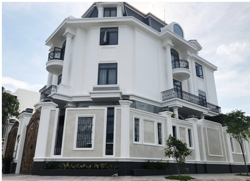
Un bâtiment influencé par le style français

Finalelement, l'occupation française a beaucoup influencé l'urbanisme au Viêt Nam du Sud. Il a un rôle majeur dans la modernisation et l'économie vietnamienne. Il marque aussi une période importante dans l'histoire vietnamienne qui ne peut pas être oubliée. Il y avait beaucoup de constructions par les Français qui ont été la base des développements urbains importants