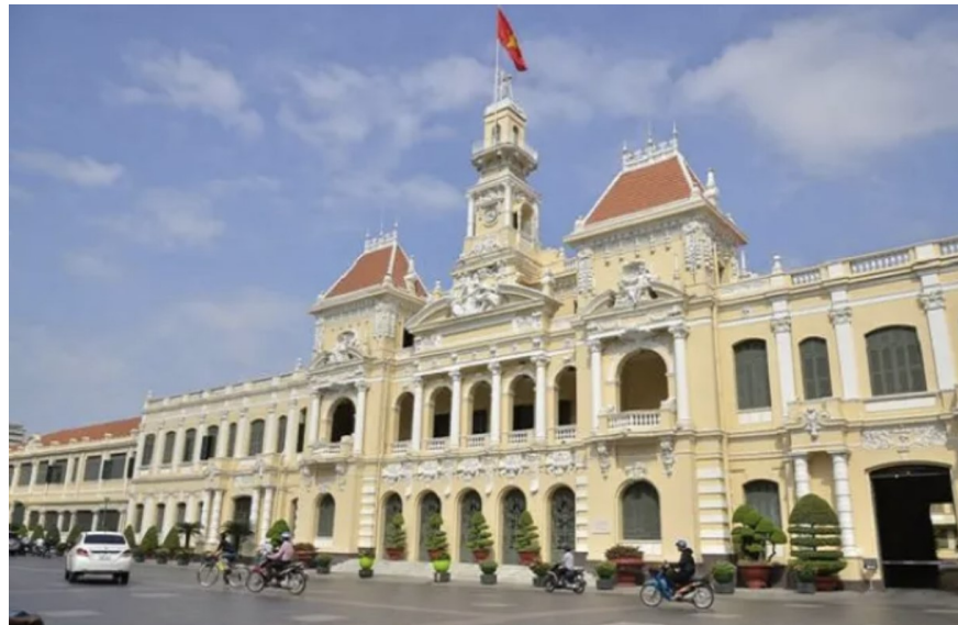
Un bâtiment du comité, désigné par l'architecte Fernand Gardès

L'influence française sur l'urbanisme a un rôle important à Saïgon et au Viêt Nam du Sud. Les rénovations françaises étaient l'une des premières tentatives de la modernisation dans ce pays. Aujourd'hui, même si le Viêt Nam a gagné son indépendance et les Français n'occupent plus le pays, l'architecture française reste, surtout à Hô-Chi-Minh-Ville. Nombreux de constructions françaises ont été utilisées comme bâtiments résidentiels. Pour les personnes qui aiment ce style d'architecture, ils peuvent construire leurs maisons dans ce style.