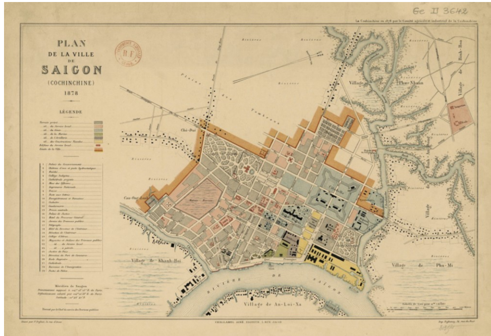
Le plan de la ville de Saïgon en 1878

Habituellement, les premières choses à construire sont les infrastructures de base comme les rues, les chemins de fer et les ports, etc., pour renforcer les modes de transport, les matériaux de construction pour la construction future. Le premier chemin de fer en Indochine a été construit en 1881 et utilisé en 1885, il s'appelle le chemin de Sài Gòn - Mỹ Tho. C'est un chemin très important parce qu'il relie le centre de Saïgon avec le grand delta où beaucoup de cultures sont produites. Par conséquent, il promeut la modernisation au Viêt Nam du Sud. Des infrastructures similaires ont été construites pour aider à exploiter et acheminer les ressources et les produits coloniaux, comme le caoutchouc ou le café, grâce aux chemins de fer jusqu'aux montagnes. Avec le temps, le système de transport vietnamien a été beaucoup développé sous l'occupation française. À la fin, ce développement a joué un rôle important dans l'économie vietnamienne.