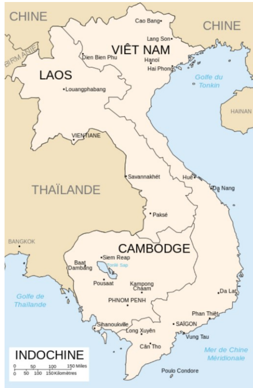
La carte de l'Indochine

Pendant près d'un siècle de colonisation, les Français ont beaucoup influencé l'urbanisme vietnamien. Le début de la colonisation française au Viêt Nam en 1884 était directement inspiré des travaux haussmanniens, une modernisation d'ensemble de la capitale française de 1853 à 1870 par le roi Napoléon III. Il s'agissait d'une modernisation urbaine dans Paris et le pays entier. La dynamique de cette modernisation s'est poursuivie dans les colonies françaises, et le Viêt Nam n'était pas une exception. Au Viêt Nam, les Français pouvaient mieux exploiter les ressources coloniales. Peu après le début de l'occupation au Viêt Nam, ils avaient commencé à faire des plans de rénovation là-bas par les ingénieurs et les planificateurs français d'abord, au Viêt Nam du Sud, puis dans le reste du pays, surtout dans les grandes villes comme Saïgon ou Hanoi. Saïgon a été choisi comme la capitale de la France dans l'Indochine de 1887 à 1902, et de 1945 à 1954 parce c'est la principale ville au Viêt Nam du Sud.