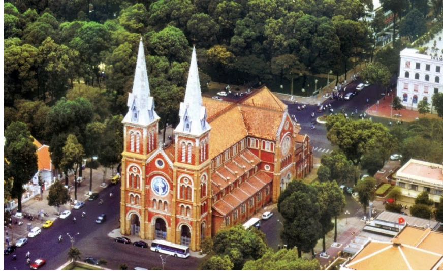
Le Cathédrale Notre-Dame de Saïgon