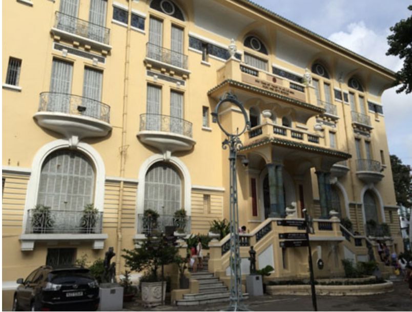
Un vieux bâtiment construit par les français